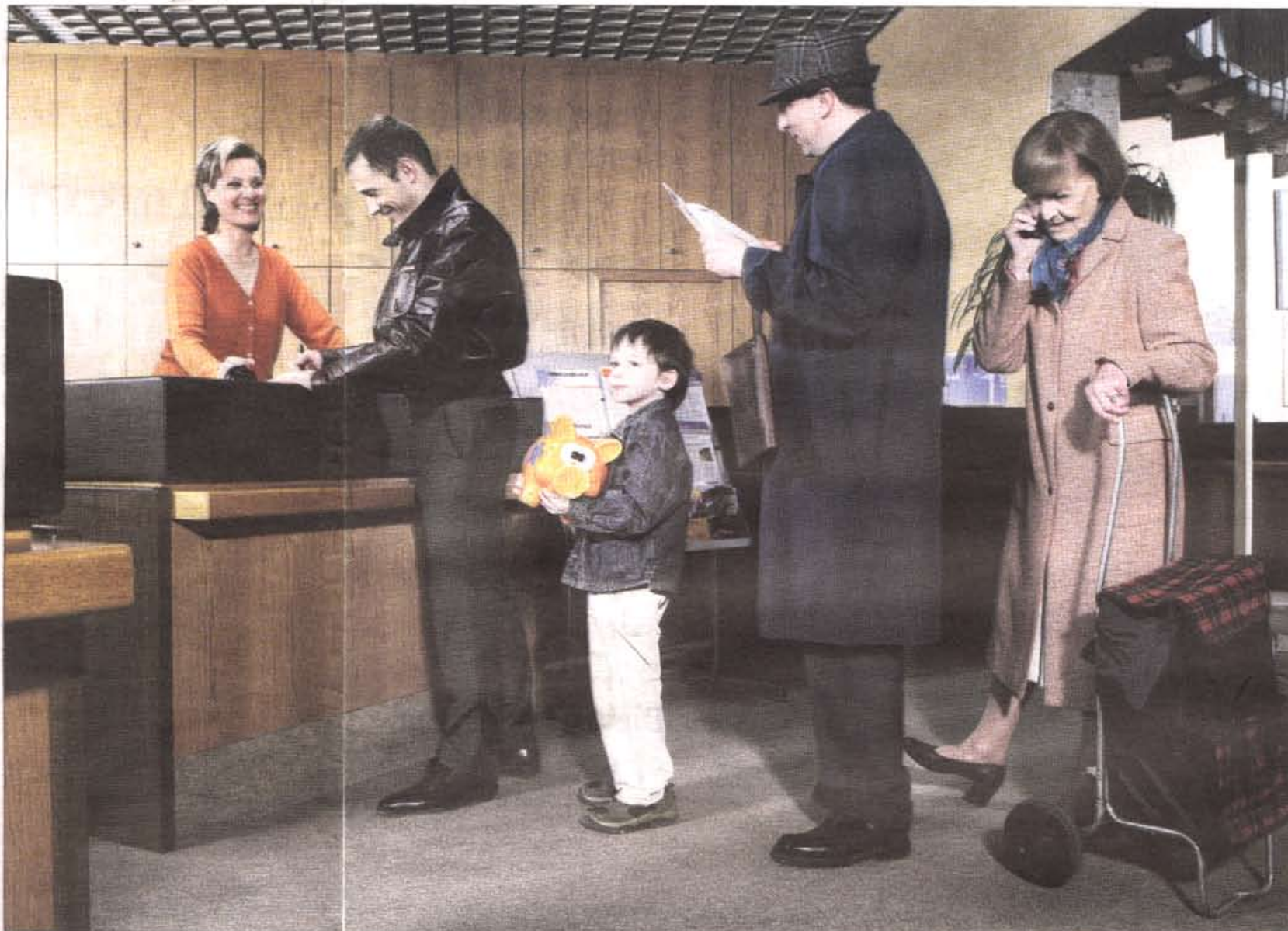
Ondanks de kredietcrisis kunnen banken zich nog steeds verheugen in een groot vertrouwen van hun klanten.

Iets anders speelt ook mee in de psyche van de klant, vermoedt Van Luyt. „Zolang je problemen niet in je eigen portemonnee voelt, zijn wij Nederlanders wel een goedgelovig volk. We zijn kritisch in een praatje