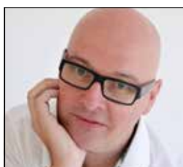
Auteur René Teuwen interimmanager en marketing effectiveness consultant

In April 2019 legde FCA een wereldwijde investeringsbank een boete op van 4,3 miljoen pond wegens het niet compliant zijn op MiFID II. Dit zorgt voor een toenemende druk voor bedrijven om aan alle wettelijke voorschriften te voldoen. Investerings-technologieën die kunnen voldoen